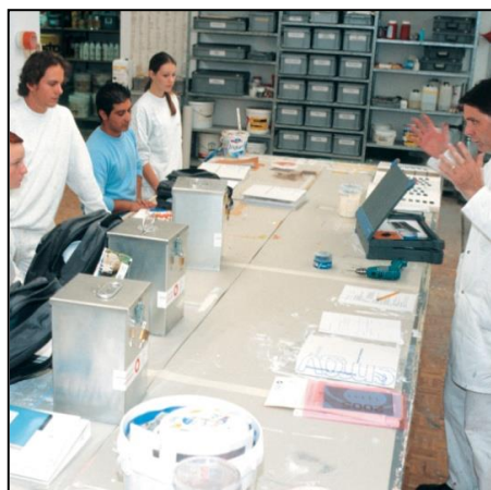
Facetten einer modernen Maler-Ausbildung.

Berufswunsch? Irgendetwas farblich-handwerkliches, wo man sieht was man geschaffen hat!